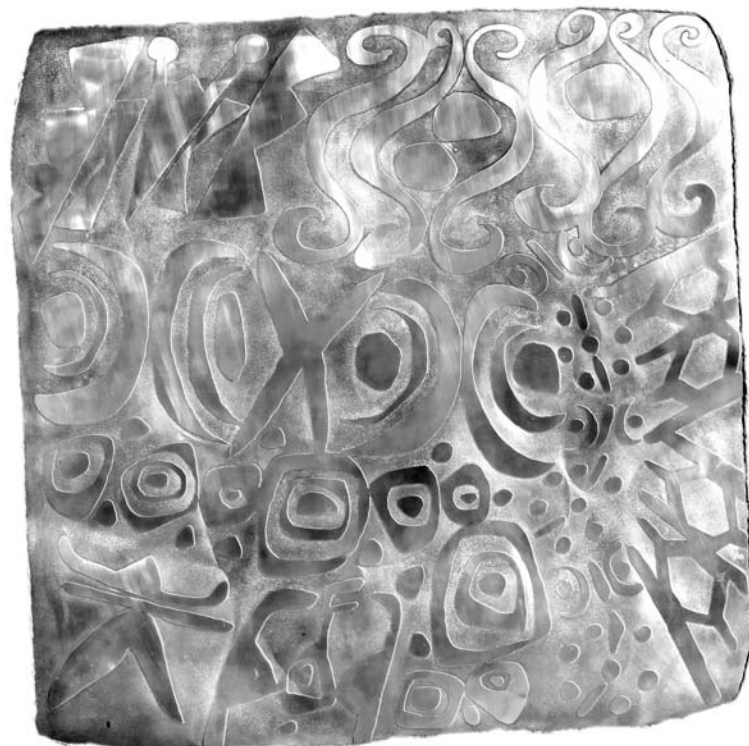
Su alma habita en la luz. Detalle

Pero las intenciones no son el único a priori. La pregunta ética se instala en un mundo Neoliberal y globalizado. Hoy la preocupación ética parece ser una preocupación universal. Todo el mundo se refiere a la falta de ética en casi todas las instancias. Sin embargo, encontramos algunas contradicciones sobre todo desde el horizonte de la corrupción: Les exigimos ética a las personas cuando los principales valores que la cultura ha construido son los económicos. Zizek dice que la economía es lo real y la política un teatro de sombras . Tener más, consumir más, gozar más son objetivos de una sociedad que también quiere ser ética. Aquello que se presenta como ideal, siendo contrario a la ética, es lo que se quiere moralizar cuando existen asimetrías y culpabilidades profundas. Se insiste en que el único dominio posible es el de las privatizaciones y nos quejamos por la ausencia de una ética de la solidaridad. Volver a la ética dentro de una sociedad que ha tomado estas opciones es una ilusión. El deber ser de la ética no tiene cabida. En efecto, la ética deviene un asunto de héroes que son éticos por nosotros.