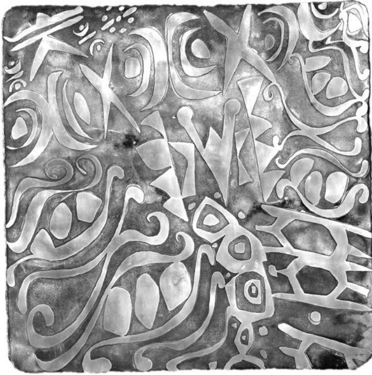
Qué devolvemos a la naturaleza. Detalle

gendra la laicidad. La tercera mutación es la des-territorialización del conocimiento por el desarrollo de la comunicación. Si antes el conocimiento sin mayores modificaciones se ejercía hasta finales de su vida, éste se transmitía a sus hijos, influía en varias generaciones, ahora una sola generación está afectada por rápidos cambios en los conocimientos. La biodegradabilidad del conocimiento es más evidente. La rapidez de los cambios nos despoja de toda certeza e impiden la respuesta inmediata a la pregunta ¿quiénes somos? Por tal motivo, ya no nos interesa el saber sino el hacer y el hacer con el saber. El por qué aparece como una pérdida de tiempo. Todo se resuelve en el cómo sin tener conciencia del por qué, debido a que se cree que el cómo tiene la magia de todos los por qué. Además, la multiplicidad de sentidos sin relación son las fragmentaciones que nos sitúan en el